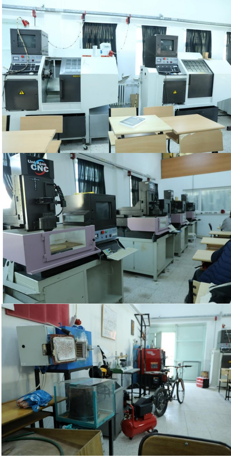
Şekil 1. Program bünyesinde bulunan CNC atölyesi

dersleri için TBMYO bünyesinde bulunan bilgisayar laboratuvarları kullanılmaktadır. Bunun yanında CNC laboratuvarında ısıl işlem fırını, kaynak makineleri de mevcut olup uygulama amaçlı kullanılmaktadır (Şekil 1).