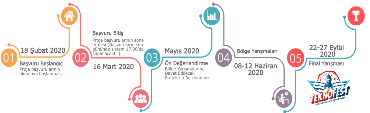
Şekil 3: Yarışma Takvimi

5.1 Yarışma için yılda bir kez başvuru alınır. Yarışma kapsamında önce 12 bölgede bölge sergisi düzenlenir, sonrasında final sergisi yapılır. Aşağıdaki Şekil 3'de süreç özetlenmiştir.